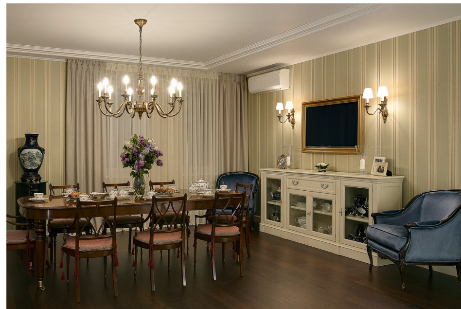
В столовой деликатно разместились антиквариат XVII и XVIII веков, эти предметы делают интерьер особенным. Из мебели ярко выделяются кресла Тоссопова (интерьерный салон «Арредаменти»).

Квартира площадью 138 кв. м находится, пожалуй, в самом престижном жилом доме в Пятигорске, между сквером Лермонтова и храмом Христа Спасителя. Заказчица — дама с характером, пожелавшая видеть свое жилье в насыщенной стилистике классицизма.