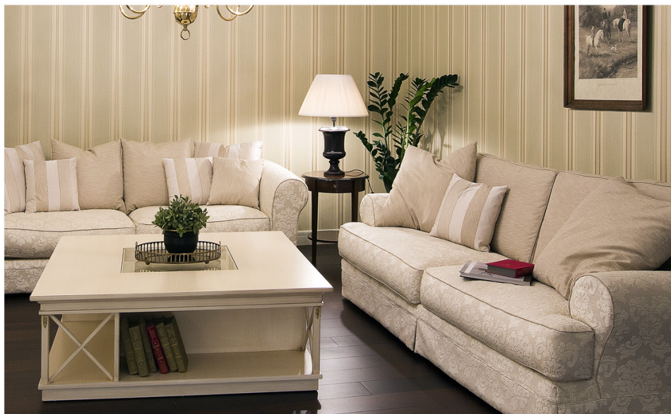
Журнальный стол внушительных размеров фабрики Angelo Sarrellini (салон мебели AP Luxury Brands) особенно хорош на фоне темного пола.