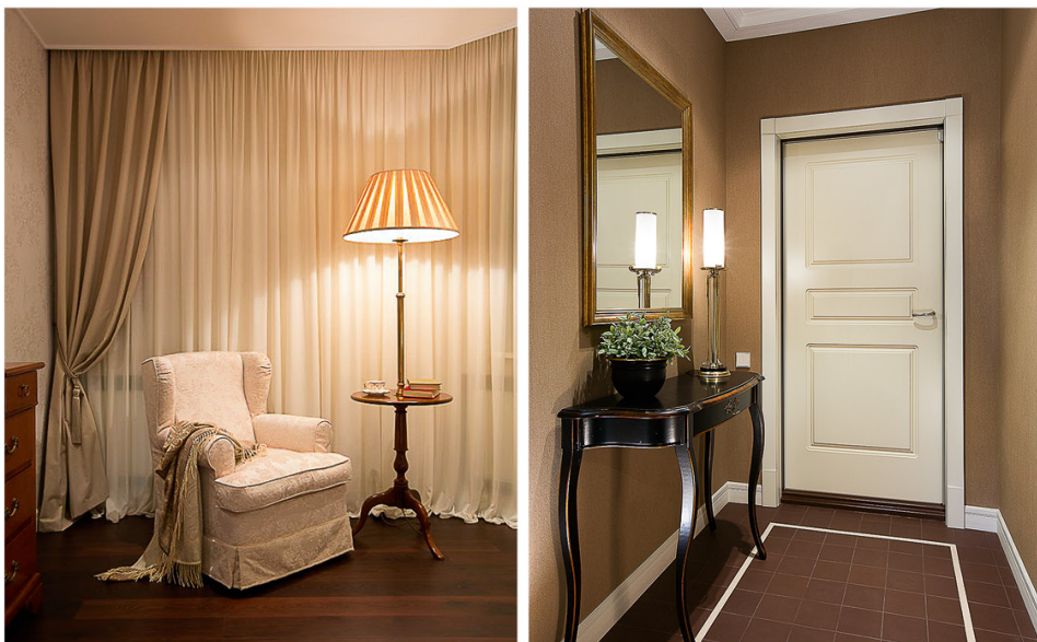
Нарочитый минимализм и лаконичность аксессуаров отводит ключевую роль отделке стен и мебели.