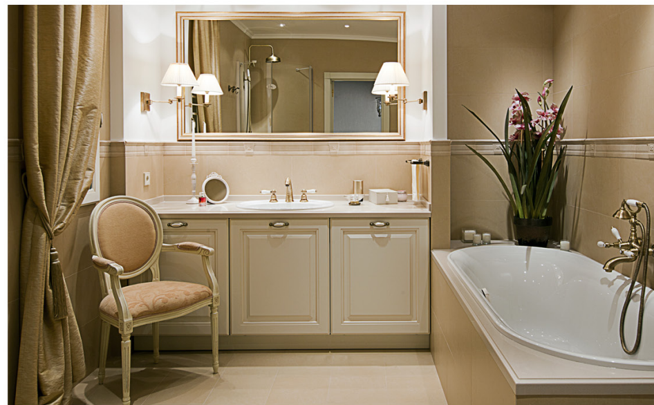
Сделать ванную полноценной комнатой удалось благодаря окну, которое обеспечивает естественное освещение. Кресло Toscolana (интерьерный салон «Арредаменти»).