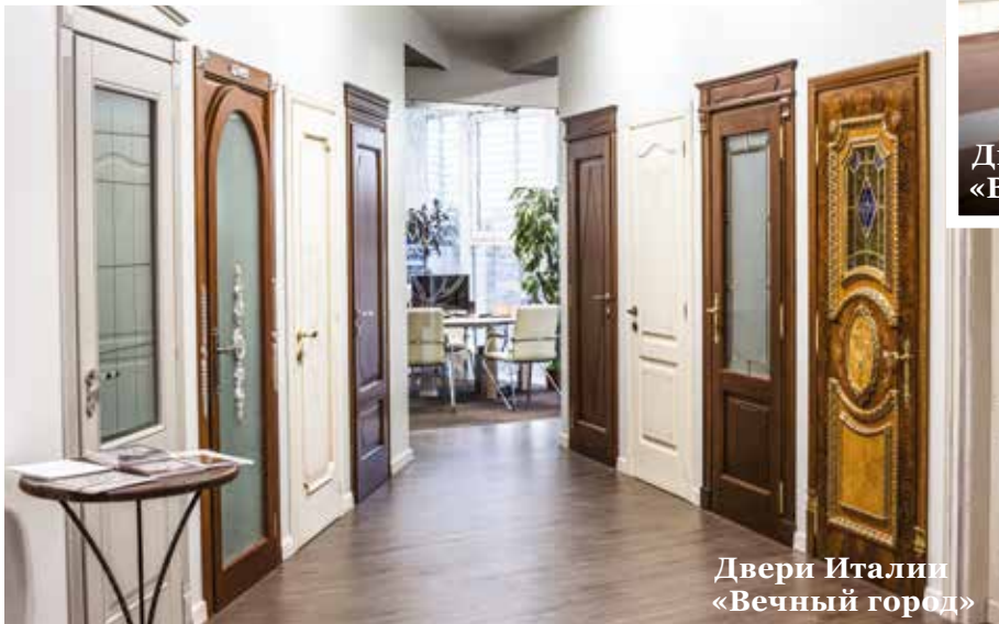
Двери Италии «Вечный город»

«Выбирая двери, мы ознакомились со всеми представленными вариантами. Нам понравились многие модели: сразу видно, что это качество, проверенное временем! Поскольку интерьер задуман нами в классическом стиле, мы остановились на межкомнатных дверях из коллекции Classic от производителя Agorprofil».