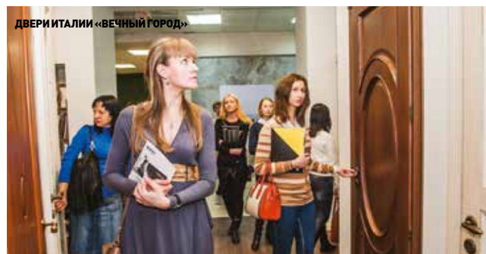
ДВЕРИ ТАЛИИ «ВЕЧНЫЙ ГОРОД»