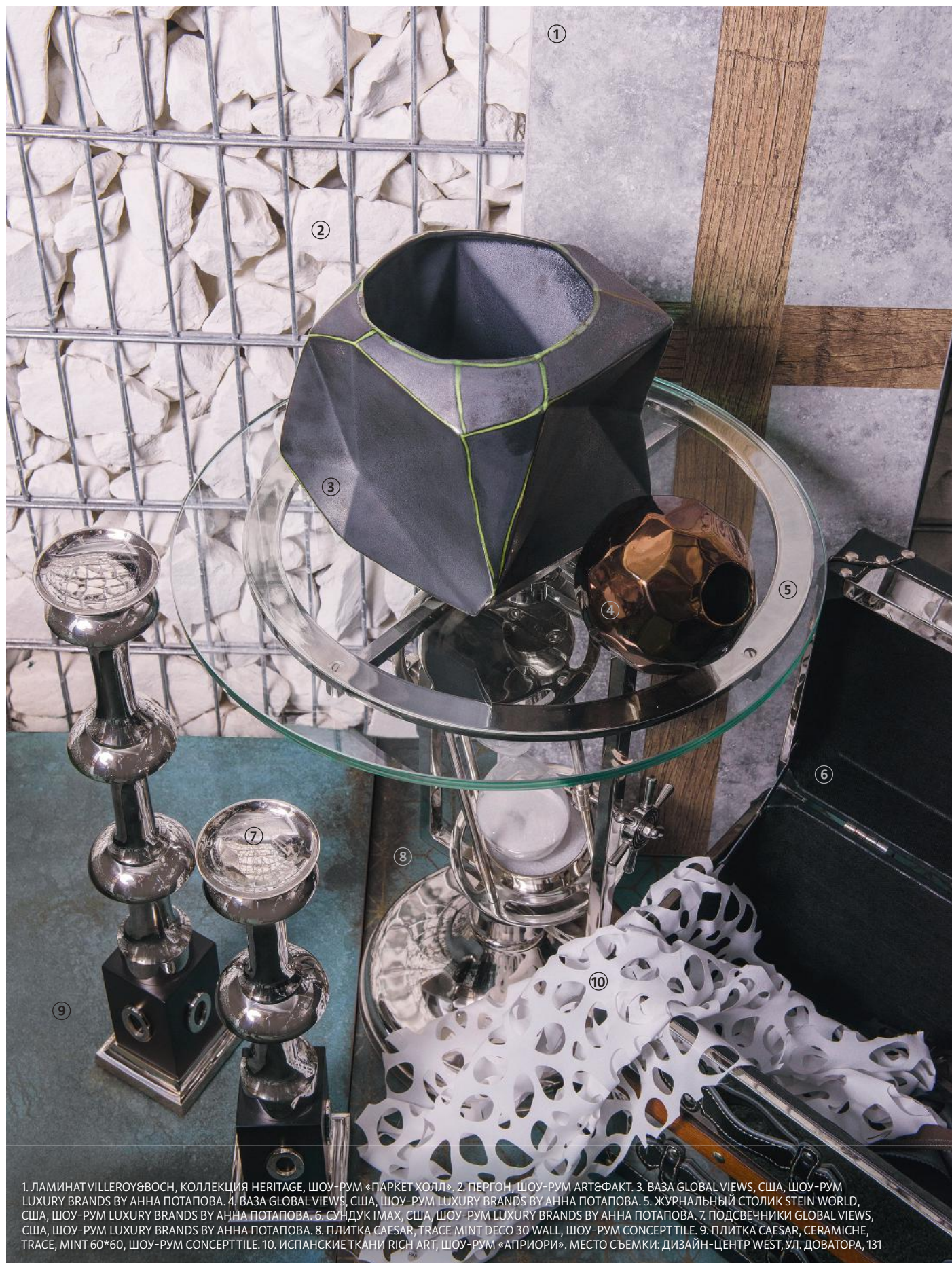
1. ЛАМИНАТ VILLEROY&BOCH, КОЛЛЕКЦИЯ HERITAGE, ШОУ-РУМ «ПАРКЕТ ХОЛЛ». 2. ПЕРГОН, ШОУ-РУМ АРТ&ФАКТ. 3. ВАЗА GLOBAL VIEWS, США, ШОУ-РУМ LUXURY BRANDS BY АННА ПОТАПОВА. 4. ВАЗА GLOBAL VIEWS, США, ШОУ-РУМ LUXURY BRANDS BY АННА ПОТАПОВА. 5. ЖУРНАЛЬНЫЙ СТОЛИК STEIN WORLD, США, ШОУ-РУМ LUXURY BRANDS BY АННА ПОТАПОВА. 6. СУНДУК IMAH, США, ШОУ-РУМ LUXURY BRANDS BY АННА ПОТАПОВА. 7. ПОДСВЕЧНИКИ GLOBAL VIEWS, США, ШОУ-РУМ LUXURY BRANDS BY АННА ПОТАПОВА. 8. ПЛИТКА CAESAR, TRACE MINT DECO 30 WALL, ШОУ-РУМ CONCEPT TILE. 9. ПЛИТКА CAESAR, CERAMICHE, TRACE, MINT 60*60, ШОУ-РУМ CONCEPT TILE. 10. ИСПАНСКИЕ ТКАНИ RICH ART, ШОУ-РУМ «АПРИОРИ». МЕСТО СЪЕМКИ: ДИЗАЙН-ЦЕНТР WEST, УЛ. ДОВАТОРА, 131

Стили: Марина Добренко